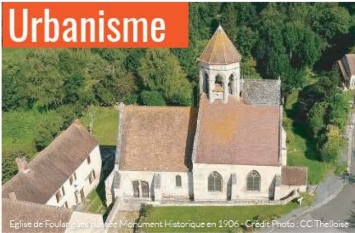
Eglise de Foulainques classée Monument Historique en 1906