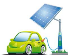
Le solaire Thermique