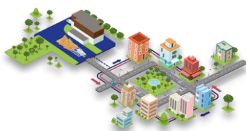
Réseau de chaleur