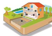
Géothermie de surface & profonde